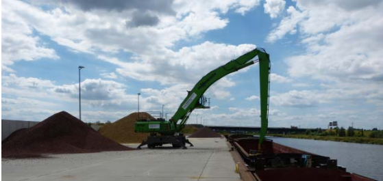
Hafen Wustermark „HavelPort“

Das Land Brandenburg ist das wasserreichste Bundesland und besitzt ein dichtes leistungsfähiges Wasserstraßennetz mit einer Vielzahl von Binnenhäfen, das auch für die Güterschifffahrt noch stärker genutzt werden soll.